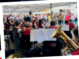
Auftritte an Rhein & Mosel