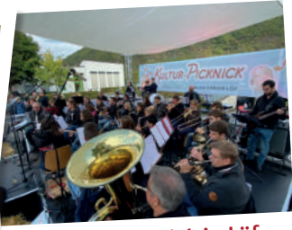
Kultur-Picknick in Löff