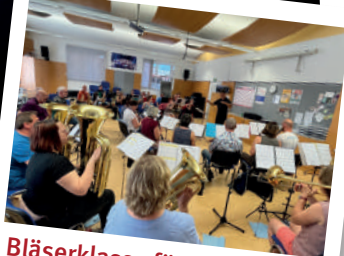
Bläserklasse für Erwachsene