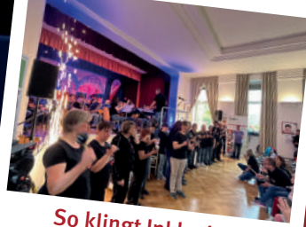
So klingt Inklusion!