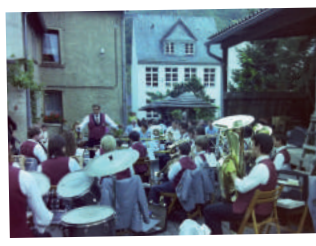
Tradition & Brauchtum