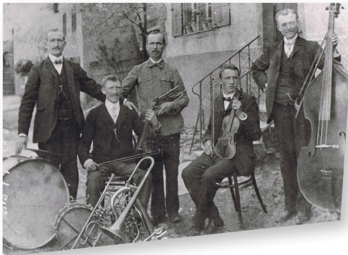
Die Löfer „Kapelle Wolf“ (um 1905/1910).

Springen wir ein paar Jahrzehnte weiter. Das nachstehende Foto dürfte (schätzungsweise) aus der Zeit um 1905/10 sein und ist beschriftet mit „Kappele Wolf, Löef Mosel“.