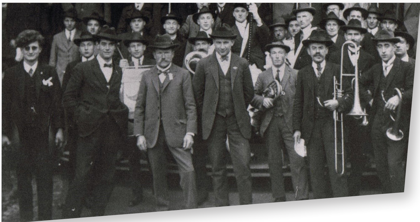
Einige Mitglieder des Männergesangsvereins Löff 1920 e.V. mit Blasinstrumenten und Paarbecken (um 1930)