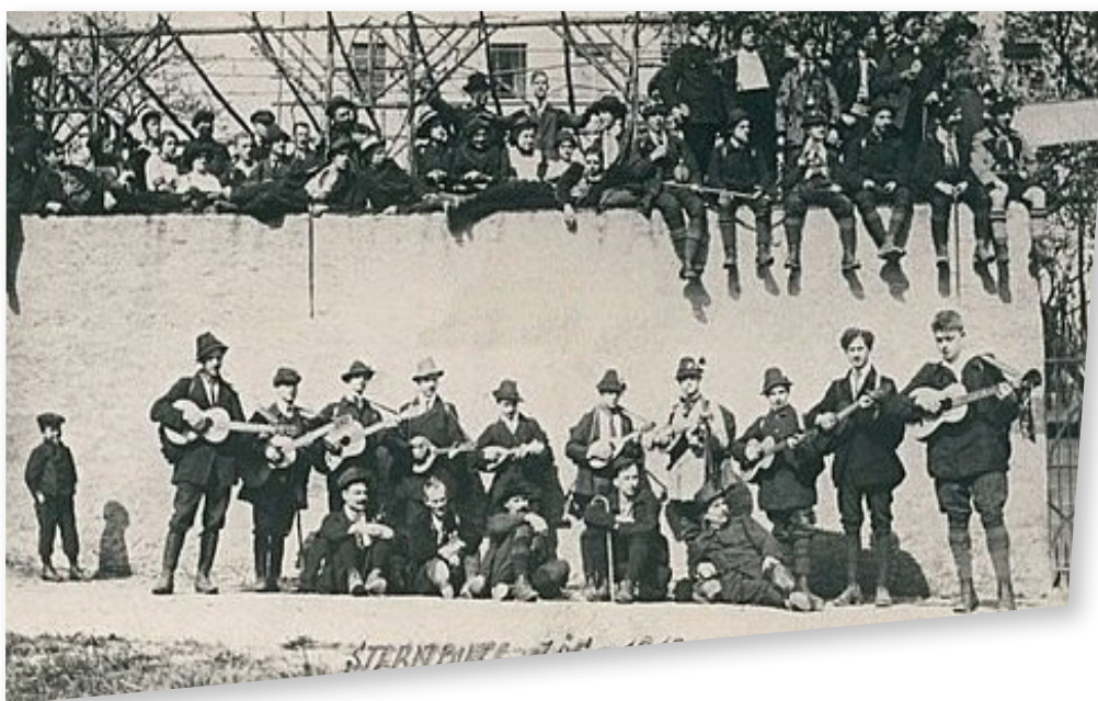
Eine musikalische Wanderguppe macht Rast vor dem Löffler Hotel Sternburg (1913)

So werden auch die allerwenigsten Löffler Teil der „Wandervogelbewegung“ Anfang des 20. Jahrhunderts gewesen sein. Mit Gitarren und Mandolinen ausgestattete Wander-, lese- und sangesfreudige Gruppen junger Menschen waren vor allem an so manchen Mai(feier)tagen auf den Wanderwegen und in Gasthäusern anzutreffen.