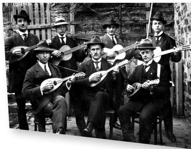
Hatzenporter Mandolinclub (1921)

Schon immer wird es talentiertere und weniger talentierte „Ton-Treffer“ und Instrument-Virtuosen gegeben haben. Es wird wohl den Allerwenigsten vorbehalten gewesen sein, ein musikalisches Talent weiterentwickelt und ausgelebt haben zu können. Wohl am ehesten vielleicht den wenigen Landburschen und -mädchen, die höhere Schulbildungen erhielten, „Lehrjahre“ in den Städten bestritten oder klerikale Lebenswege einschlugen. Diejenigen mit den größten musikalischen Begabungen und Neigungen im Dorf waren oftmals die Lehrer - nicht selten waren sie es auch, die die Aufgabe des Organisten (Orgelspielers) in der örtlichen Kirchengemeinde dann übernahmen. Nur in ganz wenigen Einzelfällen konnten Männer, die in unseren Dörfern lebten, den Lebensunterhalt für sich und ihre Familien (nur) aus der Musik bestreiten.