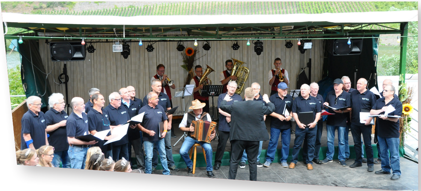
Gemeinsame Aufführung beim Weinfest in Löffel 2019 mit einer Bläsergruppe vom MV Löffel

Im kommenden Jahr 2020 kann der Verein sein 100-jähriges Vereinsjubiläum begehen. Das ist ein sehr guter Grund, dieses Jubiläum gebührend zu feiern. Auch um an das zu erinnern, was in diesem Jahrhundert entstand und auch die Möglichkeit zu erhalten, denen zu danken, die das alles ermöglicht haben.